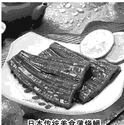
日本传统美食蒲烧鳗

自古以来日本人就非常喜欢吃鳗鱼，鳗鱼的消费量也是全世界最大的。夏天吃鳗鱼已经成为日本的习俗之一，像西洋人在复活节吃火鸡一样，是根深蒂固的传统习俗，6000家的鳗鱼饭专门店证明了日本人对鳗鱼的狂热，甚至还有吃鳗鱼特定的日子——「土用丑日(Doyou no Ushi no Hi)」(立秋前