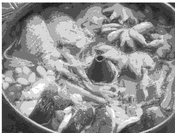
有中国味儿的枸杞炖鳗

近年来，由于哈日风兴起，国人也逐渐接受吃鳗鱼的观念，加上鳗鱼冷冻食品的开发，使鳗鱼食用更加便利。日式餐厅的蒲烧鳗定食、蒲烧鳗寿司，以及各大便利商店的蒲烧鳗便当，随处可见的鳗鱼料理，让鳗鱼不再是贵族食品。另外，政府为了推广鳗鱼，也将九九重阳节定为食鳗节，希望将鳗鱼与「健康、长寿」连结，慢慢发展新的食鳗文化。